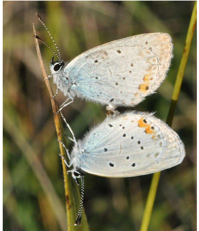
Cupido argiades, der Kurzschwänzige (Bläuling). Foto: Hannes Petrischak (ist NEU im NETZ!)