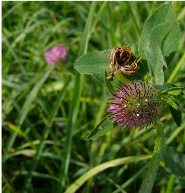
Eier des Kurzschwänzigen in Rotklee-Köpfchen

Wiese (insbesondere mit Rotklee-Blüten) auftauchen. Mittlerweile ist er sogar bei mir im Garten angekommen. Die weißen Eier findet ihr ganz leicht in noch nicht aufgeblühten Blütenköpfchen des Rotklees.